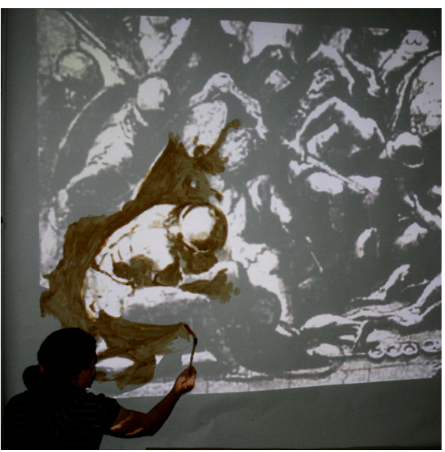
עלית (פרטי) | 2010 | קופר על נייר | 215/530 ס"מ

הרחקת העדות להזיות השוויצריות שלי נוגעת ללוחות השנה הזכורים לי מילדותי. הם נשלחו להורי בקביעות מידיד שוויצרי, והיו נתלים אחר כבוד על דלת השירותים. הייתי מתבוננת בהם ארוכות ומערה אותם אל זרם הדם התרבותי שלי. כדי הדשא והפסגות המושלגות הצטיירו עבורי כמעין מולדת אבודה בתוך הלבאנט. מבטי הנשוא מערבה ראה בנוף האירופי ממד אקזוטי, בדומה, אולי, לאופן בו תפסו בני אירופה בתחילת המאה הקודמת תרבויות פרימיטיביות כמודל נוסף. בחרתי להציב בחלל אובייקטים נוספים המעלים רעיונות של כמיהה אל האקזוטי, תוך ניכוס וזיוף מודע, דוגמת סוכריות הגומי בצורת פירות עסיסיים או שרשראות הפרחים.